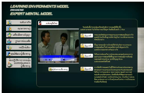
สิ่งแวดล้อมทางการเรียนรู้ที่ส่งเสริมเมนทอลโมเดลแบบผู้เชี่ยวชาญ